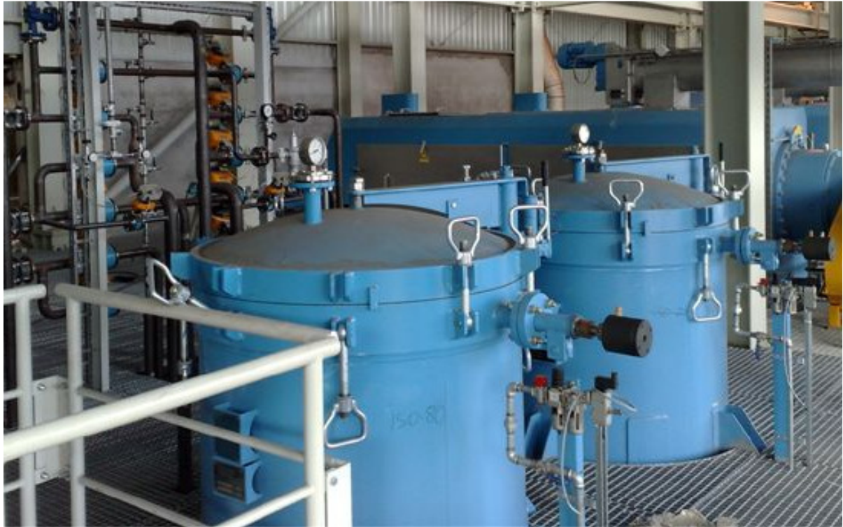
Rohöfilter für Pressanlagen