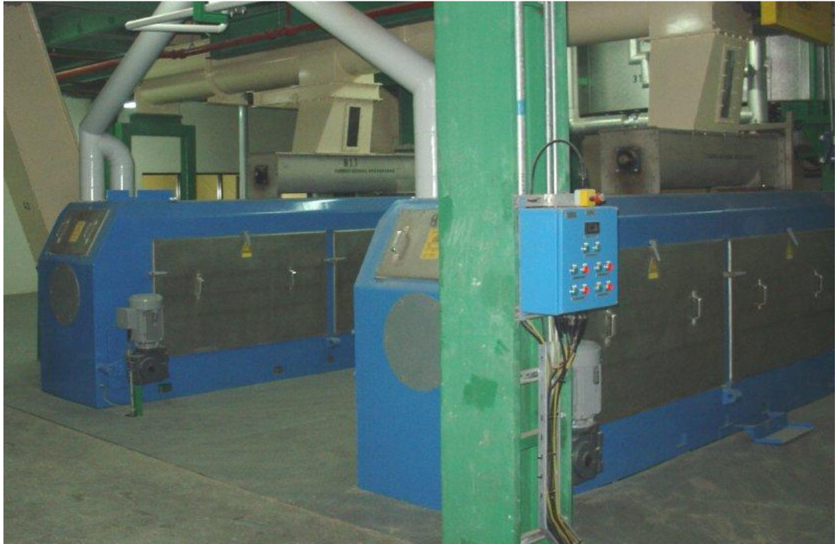
Pressen für Sonnenblumen- und Rapssaat