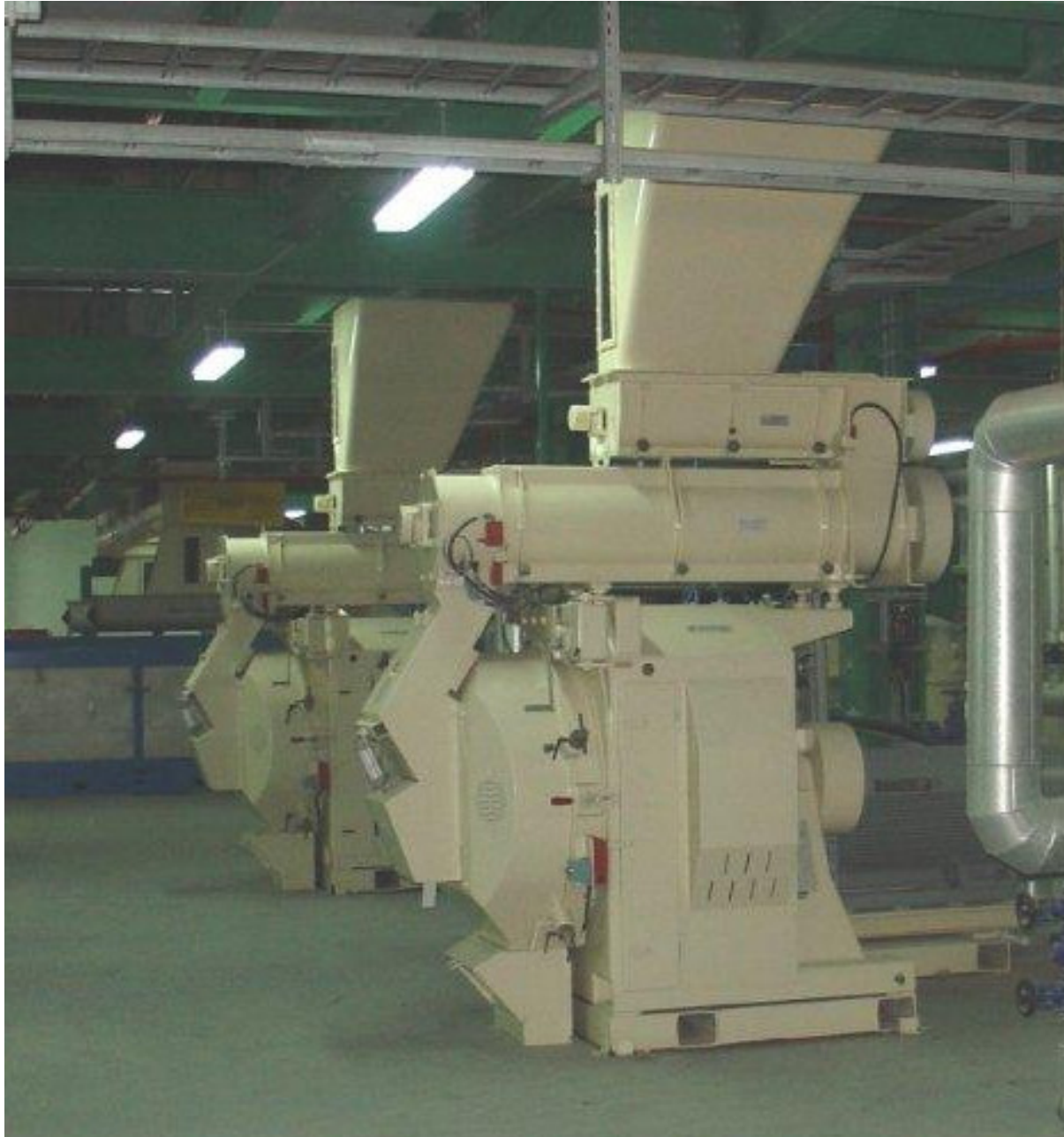
Pelletpressen für Schrot